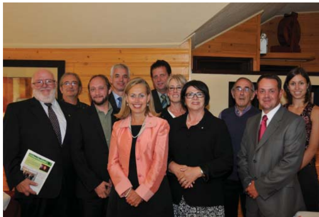
Conférence de presse. Août 2011.