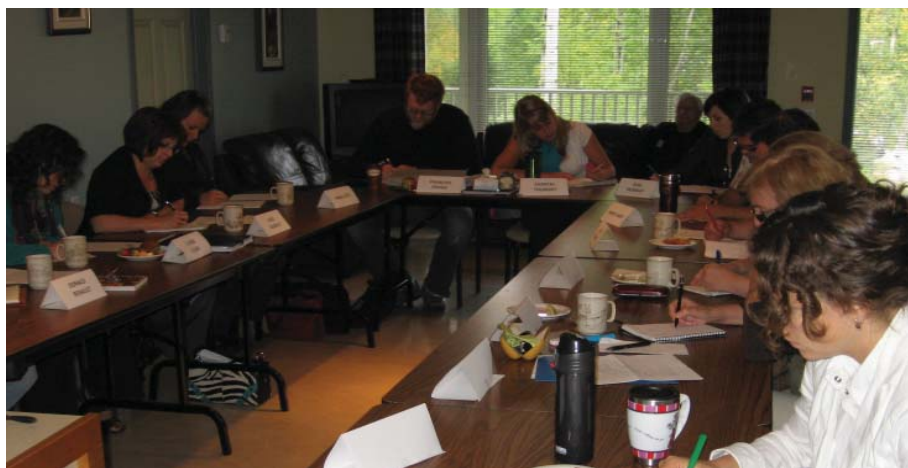
Exercice de cartographie de la ruralité de l'Abitibi-Témiscamingue. Septembre 2011.