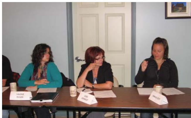
Exercice de cartographie de la ruralité de l'Abitibi-Témiscamingue. Septembre 2011.

C'est sur le site enchanteur du Centre de plein air du Lac Flavrian et dans un climat de convivialité que des professionnels en lien avec la ruralité ont participé à un exercice de cartographie conceptuelle de la ruralité de l'Abitibi-Témiscamingue. L'activité s'est tenue les 22 et 23 septembre à l'invitation de la Commission de la ruralité de la Conférence régionale des élus de l'Abitibi-Témiscamingue. À cette occasion, une quinzaine de professionnels provenant de différents milieux (santé, culture, etc.) et de chacune des MRC se sont remués les méninges sur ce que signifie et représente la ruralité de notre région selon eux. L'objectif de la démarche est de décrire la réalité de la ruralité, telle que perçue par les acteurs pour alimenter le discours régional. Ce discours favorisera une compréhension commune et une façon de travailler cohérente pour mobiliser les milieux ruraux et les amener à agir sur les aspects qui ont un sens pour eux. L'activité a été animée par Patrice LeBlanc, directeur de la Chaire Desjardins. Ce dernier analysera les données récoltées à l'occasion de cette journée. Un rapport résultera de cette activité. Rappelons que des exercices semblables avaient été menés en 2009 avec un groupe de citoyens et un groupe d'élus. Le rapport qui en résulte, intitulé Qualifier la ruralité en Abitibi-Témiscamingue est disponible sur le site de la Chaire Desjardins, sous l'onglet Recherches et publications : http://web2.uqat.ca/chairedesjardins/index.asp . ☺